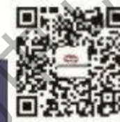
兴安盟创业项目库