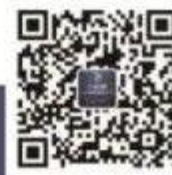
兴安盟人力资源市场